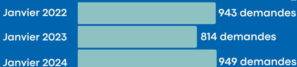
Évolution du nombre de demandes